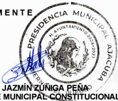
LIC. ZITLALY JAZMÍN ZUÑIGA PEÑA PRESIDENTE MUNICIPAL CONSTITUCIONAL