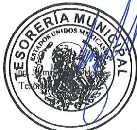
H. AYUNTAMIENTO AJACUBA, HGO. 2020 - 2024

"Bajo protesta de decir verdad declaramos que las cifras contenidas en este estado financiero son veraces y contienen toda la información referente a la situación y/o los resultados del Municipio de Cardonal, afirmando ser legalmente responsables de la autenticidad y veracidad de las mismas, y así mismo asumimos la responsabilidad derivada de cualquier declaración en falso sobre las mismas".